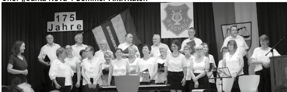
Der „Canta Nova“ sang im Juni bei 37 Grad zum 175. Geburtstag des Gesangvereins Eschau.