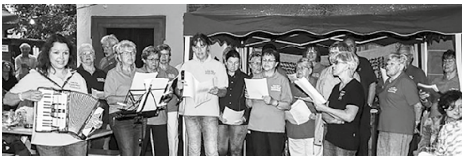
Der Chor „Canta Nova“ sang im Juli beim Kirchenfest in Kleinheubach.

Der Himmel hatte ein Einsehen mit Chor und Sommerfestgästen. Der Chor kam mit Volksliedern und Schlagern sehr gut an. Die Gäste sangen zu den einzelnen Liedern gern mit.