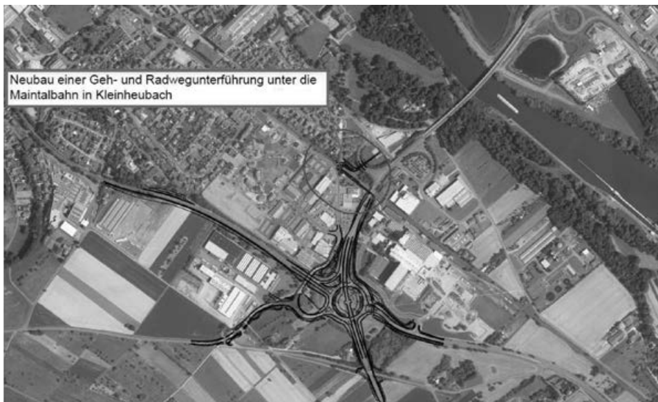
Text u. Bild 1 (Lageplan): Staatliches Bauamt Aschaffenburg